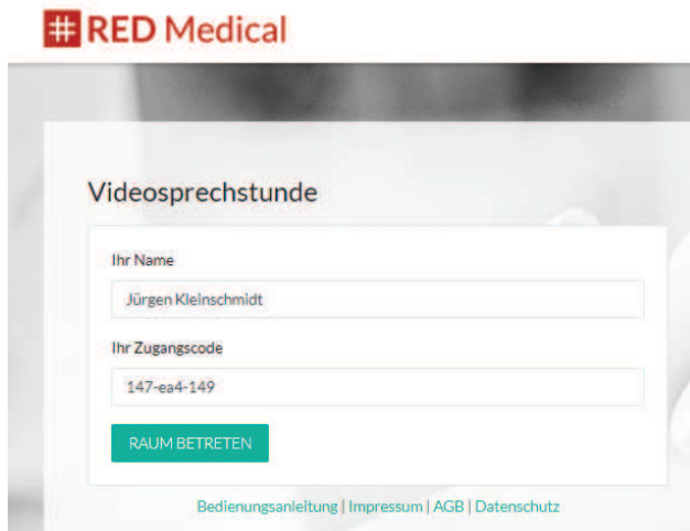
Abbildung zu Punkt 3 und 4: Name und Zugangscode eingetragen